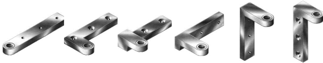
M1 M2 M3 M4 M5 M6