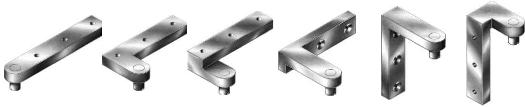
U1 U2 U3 U4 U5 U6